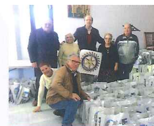
ENTREGA DE ALIMENTOS CARITAS