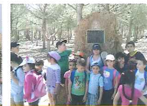
VISITA DE ESCOLARES