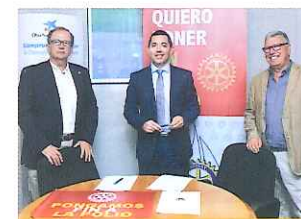
FIN A LA POLIO