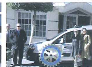
FURGONETA ALIMENTOS SOLIDARIOS